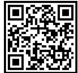
사전설명회 참가 신청 QR