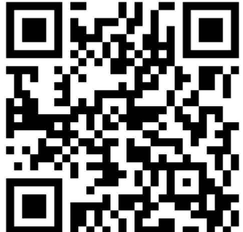
모두의 창업 오프라인 사업설명회 신청 바로가기