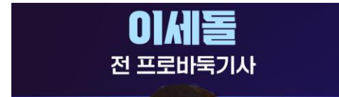
이세돌 전 프로바둑기사